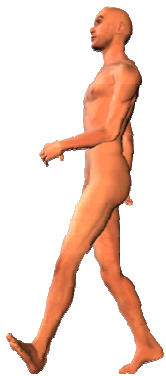
WB = S

verschillen in de spiervorming van de benen. Dat Boll zich als een echte N voortbeweegt blijkt tussen de rallies door fraai uit zijn ietwat met het lichaam vooroverhellende loopje.