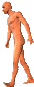
WT = N

Mensen die 'from the top' bewegen ontwikkelen vooral de spierketens die zich meer aan de achterzijde van het lichaam bevinden. Met zijn slagen werkt hij naar die sterkere PM-ketens toe, het is veel eerder te duiden als het natuurlijke van zijn motoriekstijl dan dat je bang zou moeten zijn dat het rugblessures oplevert. Van jongs af aan is de beweging naar zijn PM-ketens te herkennen.