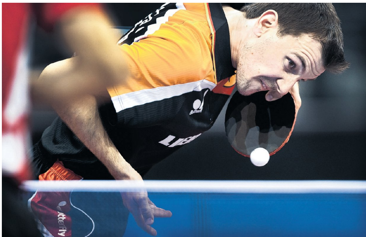
Timo Boll richt zich op het reclamelogo van het balletje om de effecten goed in te schatten.

De Universiteit van Bochum verdiepte zich drie jaar geleden in de kwaliteiten van de landgenoot die dit weekeinde duizenden Duitsers naar Rotterdam moet trekken. Hij speelt, na zijn zege (4-2) van vrijdag op landgenoot Ovtjarov, vandaag in de kwartfinale tegen de Chinees