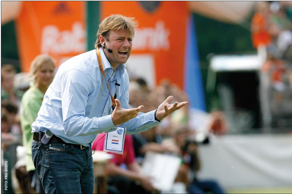
De komende jaren is het niet genoeg om 'alleen maar' coach te zijn. Er is grote behoefte aan leadership coaches , zoals Marc Lammers.